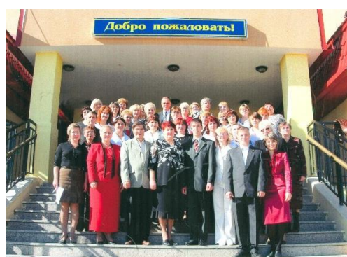
Фото 2005 г. Педагогический коллектив