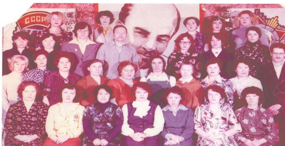
Фото 1981 года. Педагогический коллектив

В 1983-1984 учебном году открывается двухэтажное здание школы.