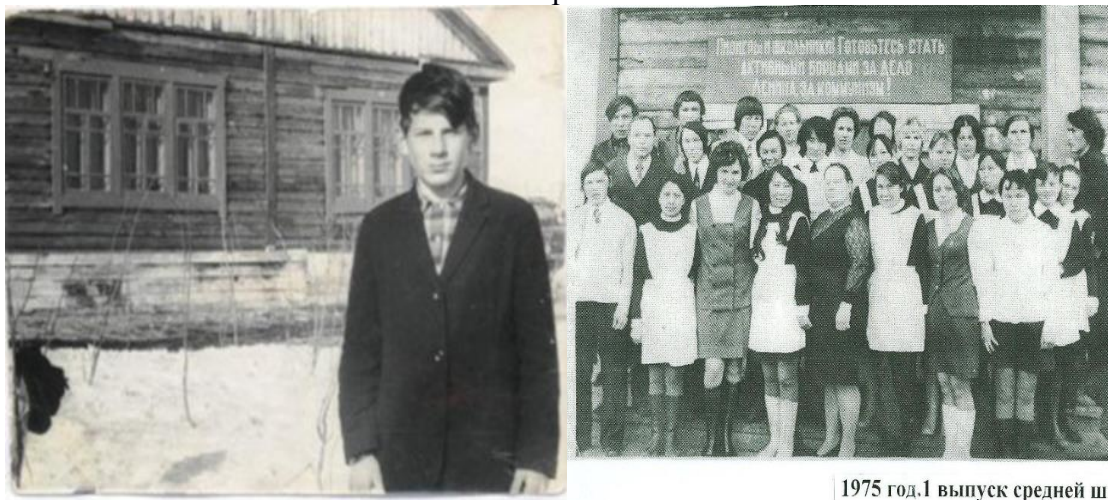
1975 год. I выпуск средней школы.

В 1979 году команда лыжников школы заняла 1 место в районе. С 1980 по 1982 год теннисисты школы являются чемпионами района.