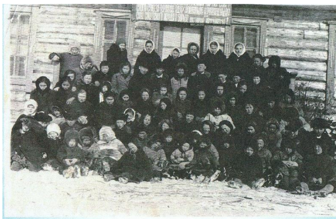
Фото 1954-1955 учебный год. Коллектив начальной школы