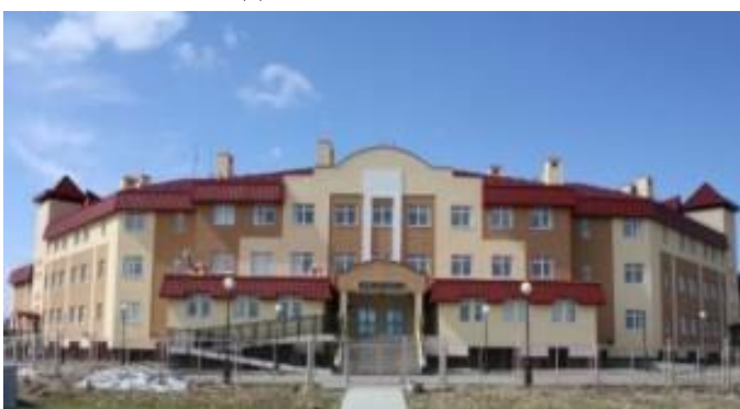
Фото. Здание школы, построенное в 2004 г.