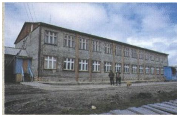
Фото 1984 г. Здание школы

В 1990 году в школе оборудован первый компьютерный класс.