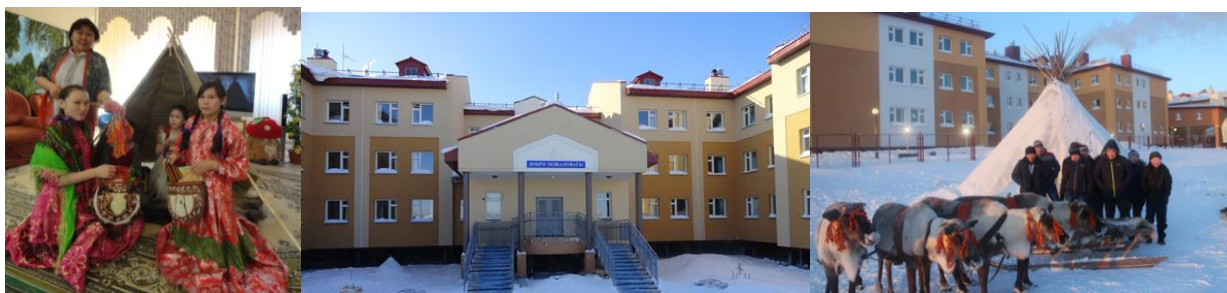
Фото Интернат семейного типа. Корпус № 1, № 2. Проект «Зимний чум».

Введена в работу многофункциональная спортивная площадка.